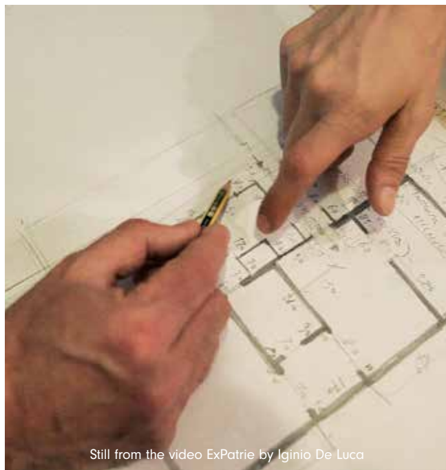
Still from the video ExPatrie by Iginio De Luca

"Al limite tra azione performativa e gesto di pubblica utilità comincio a misurare gli interni domestici" - racconta De Luca, docente all'Accademia di Belle Arti, musicista, attore, videomaker e performer. "Come un geometra del catasto, metro estraibile alla mano, traccio con carta e matita l'identikit di 17 case [...] rendo ufficiale qualcosa che ufficiale non è". Nel periodo in cui ha fatto incursione a Metropoli, De Luca ha acquistato a poco a poco la fiducia dei suoi abitanti, fino a disegnare con loro i rilievi di appartamenti spesso arredati in maniera connotata e riconoscibile.