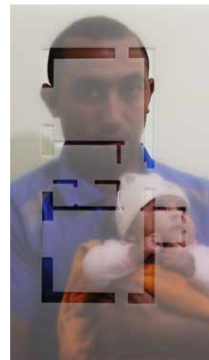
Iginio De Luca, ExPatrie